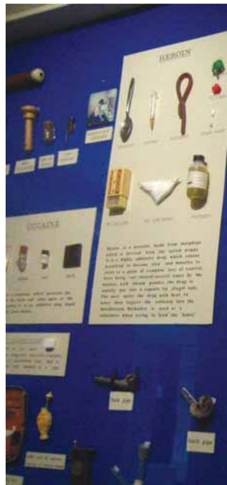
Narkotika på ett museum. I en internationell jämförelse är antalet personer som testar narkotika i Sverige lågt men att antalet personer med tunga narkotikaproblem förefaller vara förhållandevis högt.

Det står dock klart att den svenska restriktiva lagstiftningen, med kriminalisering också av bruket av narkotika, i kombination med ökade polisiära resurser för upptäckt och gripande, resulterat i en väsentligt lägre förekomst av narkotikabruk bland unga människor i Sverige. Detta ska dock ses i ett sammanhang av kraftig satsning också på opini-