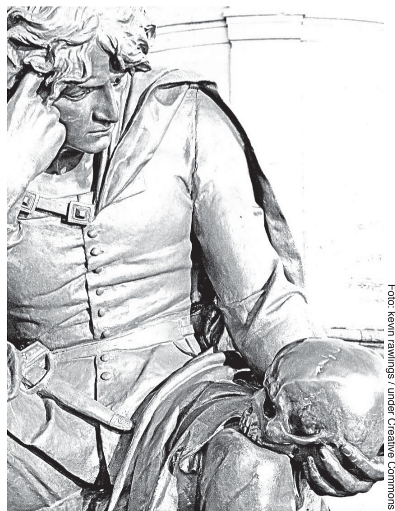
"Ty vem fördroge tidens spe och gissel, Förtryckets vrånghet, övermodets hån..."