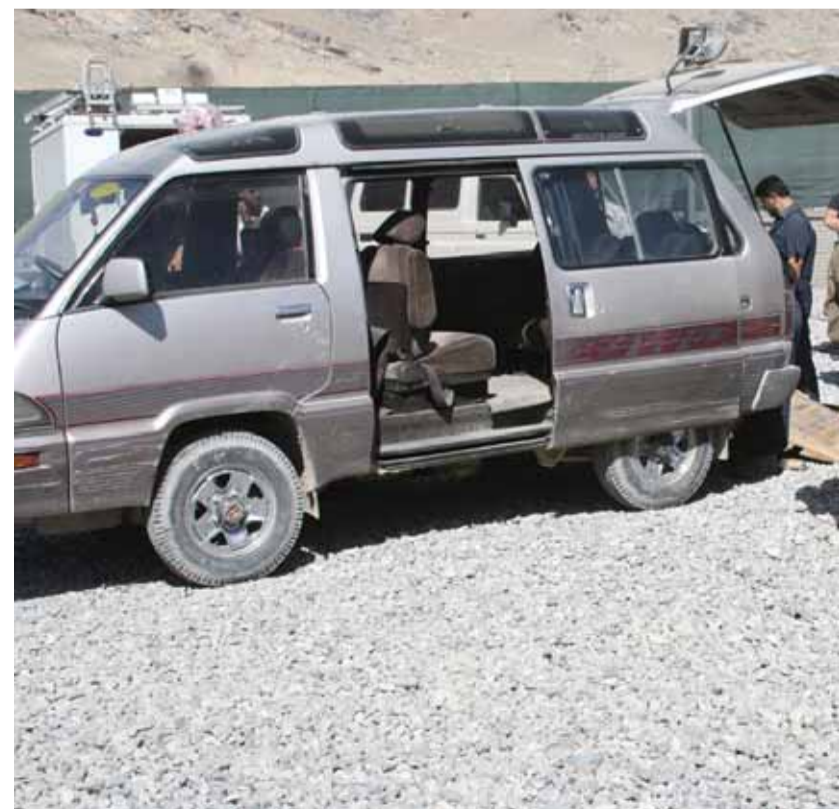
Afghansk polis söker igenom en bil efter narkotika. Narkotikafrågan kräver effektiv tillsyn och kontroll. Kriminalisering räcker inte, det måste också finnas en trovärdig risk för att bli ertappad och straffad.