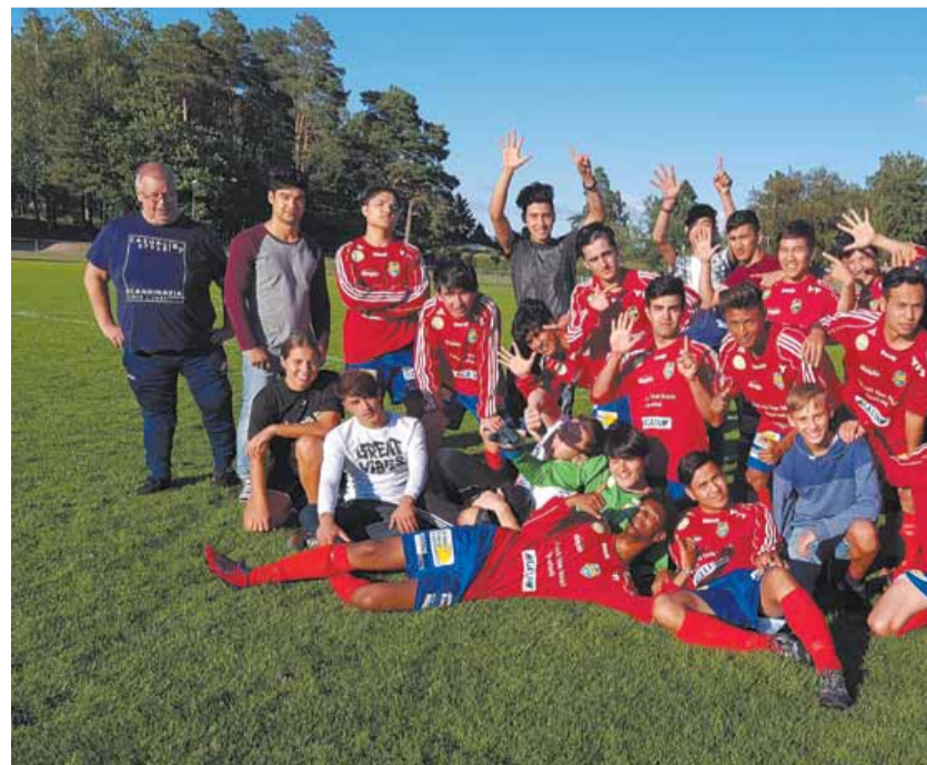
Fotbollen är den idrott som lockar flest ungdomar och det finns ett eget

NordSyd bemannar Gröna Villan 3 gånger/dygn (morgon/em/kväll) och vid akut behov andra tillfällen. Föreningen har ständigt telefonjour och schemalägger bemanningen som utgörs av frivilliga och helt ideella människokrafter. NordSyd är också behjälplig vid ungdomarnas personliga besök och kontakter på migrationsverket, skatteverk, sjukvård med mera. De kanske också får hjälpa till vid övningskörning för körkort,