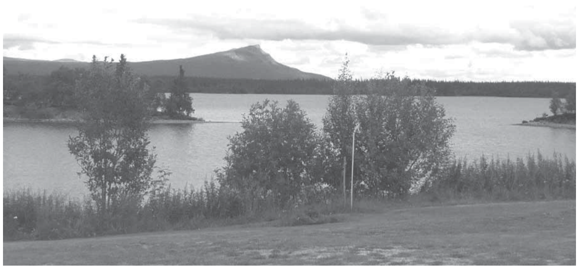
Kultsjön med Marsfjället i fonden.

är vi på plats i Saxnäs med sitt vackert belägna vandrarhem.