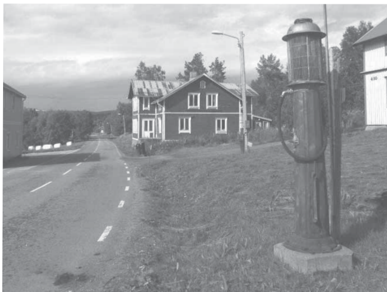
I byn Jormvattnet mötte vi denna syn. Den gamla bymacken anno 30-40-talet.