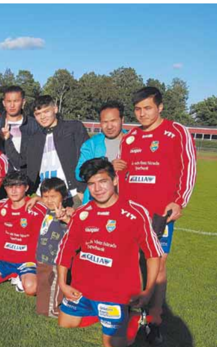
ett fotbollslag U2.

Bli medlem i Framtiden i våra händer! Vill du stödja vårt budskap om en livsstil med minskad total konsumtion, en samhällsutveckling med mindre klimatpåverkan, en mer levande landsbygd och utjämnade sociala klyftor. Bli medlem. 90 – 500 kr valfritt. Pg 2 44 19-4. Glöm inte skriva in namn och adress!